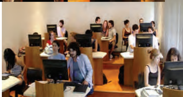
Primeiro grupo em sessão de capacitação, no dia 18 de março de 2014.

A disciplina de Psicologia Sensorial, do Departamento de Psicologia Experimental, organiza, em parceria com a Biblioteca, a capacitação dos alunos de graduação devidamente matriculados no uso das principais bases de dados para a área de Psicologia.