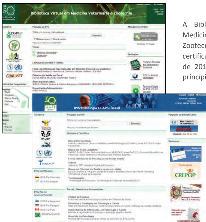
Telas principais da BVS-Vet e BVS-Psi

“Parabenizamos e comemoramos juntos com a equipe pela realização e convidamos todos a visitarem a BVS-Vet e a BVS-Psi”.