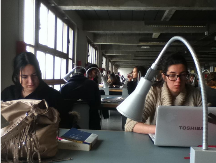
As janelas da biblioteca dão para o Senna