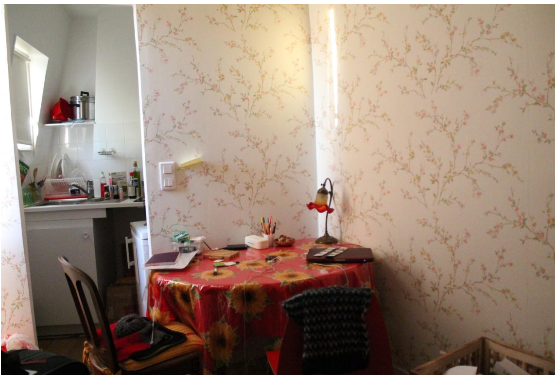
o local onde me hospedei