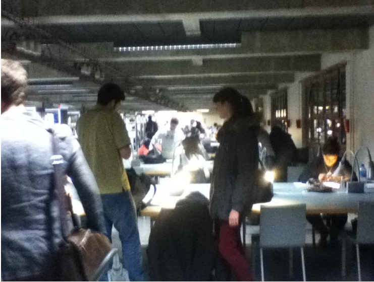
Biblioteca as 19h de sábado- horário de fechamento