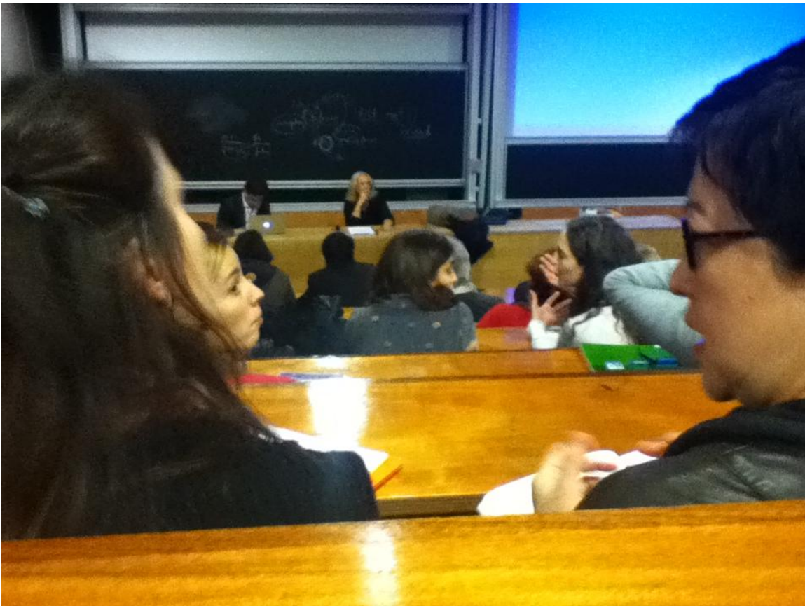
foto de um dos auditórios em momento de aula

No mural da Aliança Francesa de Paris também sempre tem ofertas de trabalho e de lugar para alugar: https://maps.google.com.br/maps?client=safari&oe=UTF-8&ie=UTF-8&q=aliança+francesa+paris&fb=1&gl=br&hq=aliança+francesa&hnear=0x47e66e1f0e2b70f:0x40b82c3688c9460,Paris,+França&cid=0,0,12925961462780381556&ei=XgxaUb3NDMHN0wGf7IHgCQ&ved=0CEYQrswAA