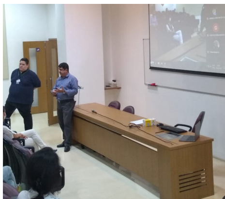
Recepção dos voluntários

No atual momento, em que a solidariedade tem se mostrado como um caminho para superação das adversidades impostas pela presente pandemia, o Hospital Universitário da USP (HU-USP) planejou e está colocando em execução um programa de voluntariado voltado aos alunos da Universidade de São Paulo, visando oferecer uma melhor assistência à população. Desta forma, foi traçada, inicialmente, uma parceria institucional com a Faculdade de Medicina (FMUSP) e Faculdade de Medicina Veterinária (FMVZ- USP), aberto a receber voluntários de outras unidades. Por meio